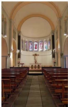
Église Saint-Pierre de Corps