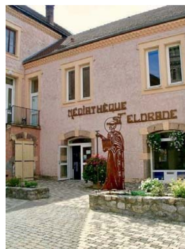
Place des Colporteurs

C'est dans l'église de Corps que la plupart des concerts ont lieu.