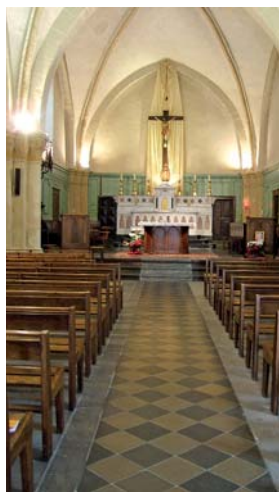
Église Notre-Dame de L'Assomption de Mens